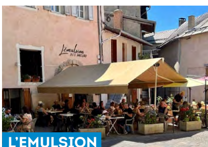
L'EMULSION DES SAVEURS

Adam et Imad vous accueillent dans leur nouveau restaurant, avec une cuisine multiculturelle à base de produits frais et locaux. Ces cuisiniers passionnés vous feront découvrir des recettes inédites en collaboration avec des producteurs et artisans de l'Embrunais.